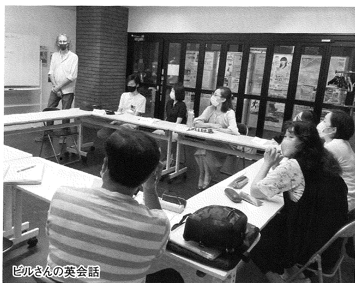
ピルさんの英会話