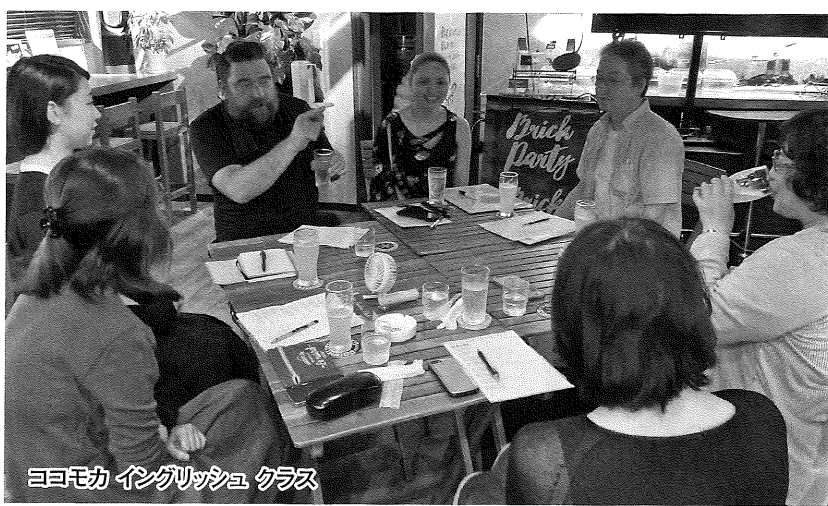
ココモカ イングリッシュ クラス

「バーレッスン」に興味のある方は小百合さんまでお問合せください。そして日常会話が出来るとなると、イギリスからお見えの方と一緒に野幌の居酒屋に行ってイギリスのパブとどちらが楽しいか自慢合戦を試してみるのもいいですね。